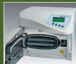
Millennium micra. 5,5 litros