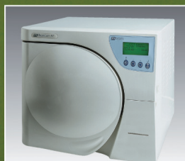
Millennium B+. 17 litros