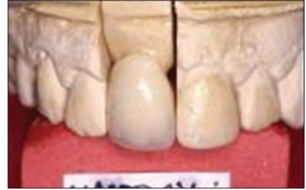
Figura 40. Corona yaket en procera

prótesis dental, y a los excelentes materiales y a sus técnicas de tratamientos, hacen que los especialistas sigan aplicando la delicadeza que se les requiere, y continúan consiguiendo la función, la estética y la belleza dental (aunque influya el metal en su opacidad en la transmisión de la luz), siempre junto a las porcelanas que le son requeridas para el