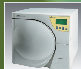
Millennium B. 17 litros