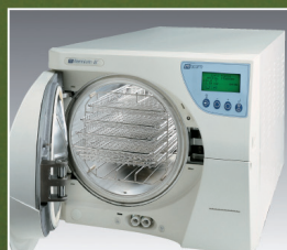
Millennium B2. 21 litros