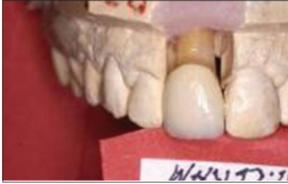
Figura 38. Corona yaket en I. ceram