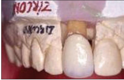
Figura 39. Corona yaket en zirconio