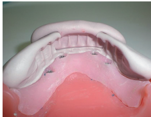
Preparación de pilares para prótesis provisional basada en frente de prueba de dientes