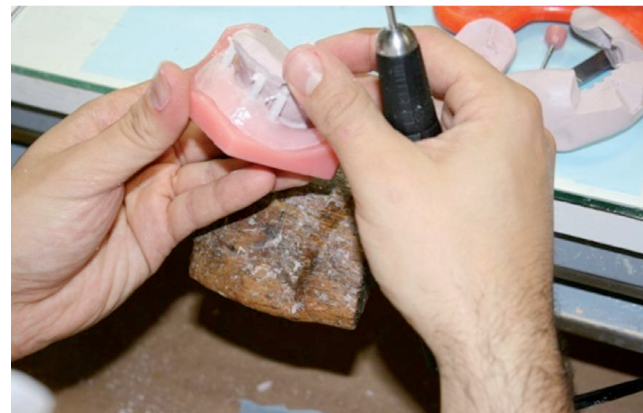
Ferulización de aditamentos para confección de prótesis provisional