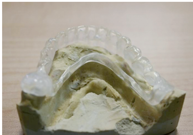
Férula para toma de registros

El montaje de esta prueba la realizaremos con dientes de tablilla montados a término. La utilización de las prótesis antiguas del paciente para esta elabora-