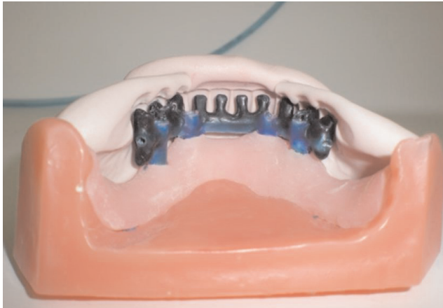
Encerado para refuerzo metálico con frentes de prueba previa a colocación de implantes