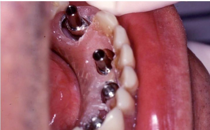
Toma de registro con prueba de dientes

obtendremos una posición fiel de los implantes. Puede parecer que es poco tiempo para la realización de esta prótesis provisional, pero teniendo en cuenta que parte del trabajo ya está hecho de un modo previo esto es posible y de ese modo cumpliremos con el compromiso y concepto de prótesis sobre implantes con carga inmediata.